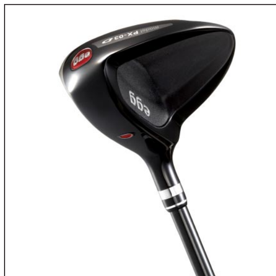
New 「egg フェアウェイウッド」