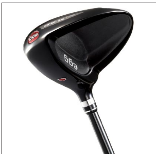
New 「egg スプーン」

「egg」シリーズは「既成概念にとらわれない」「卵(egg)の殻を打ち破る発想」「性能(飛び、やさしさ)を最優先に開発」をコンセプトに2007年9月から発売しているクラブシリーズ。2010年8月には、軟鉄鍛造アイアン「egg FORGED アイアン」もラインアップに加わる。